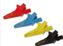
Terminale a coccodrillo rosso / blu / giallo / nero

WASONREOGB1 WASONBUOGB1 WASONYEOGB1 WASONBLOGB1 WASONBLOGB3